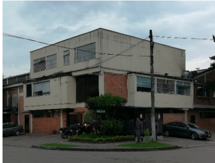
FOTOGRAFIA 1. FACHADA DEL ESTABLECIMIENTO

ALCALDÍA MAYOR DE BOGOTÁ D.C. SECRETARÍA DE AMBIENTE