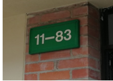
FOTOGRAFIA 2. PLACA DEL PREDIO