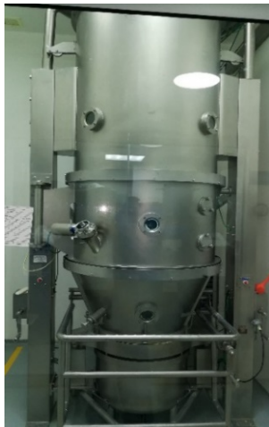
FOTOGRAFIA 3. SECADOR DE LECHO FLUIDO